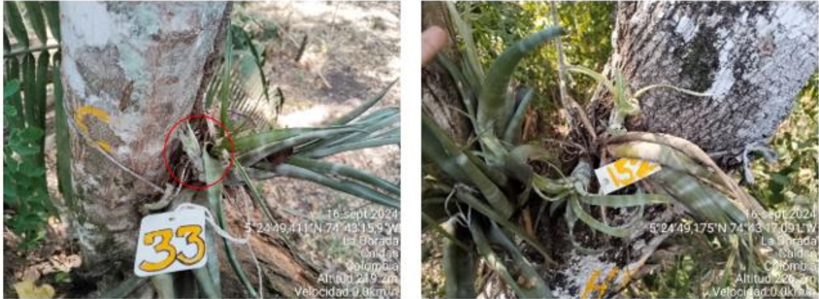
Fotografía 1. Vista de los hijuelos en las epifitas N° 33 y 152/