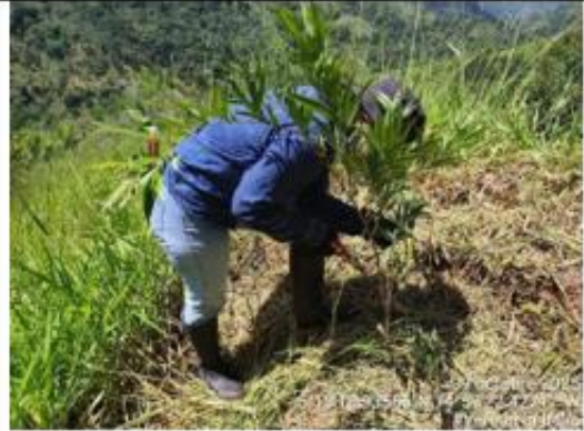
Figura 9. Podas para guiar el fuste del árbol de la especie Suribio - Zoia longifolia .