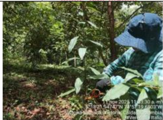
Figura 11. Podas ejecutadas a individuos en el predio La Divisa, núcleo 4.