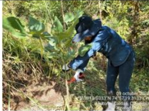
Figura 8. Poda a ras de tallo del árbol, sin causar daños al árbol.