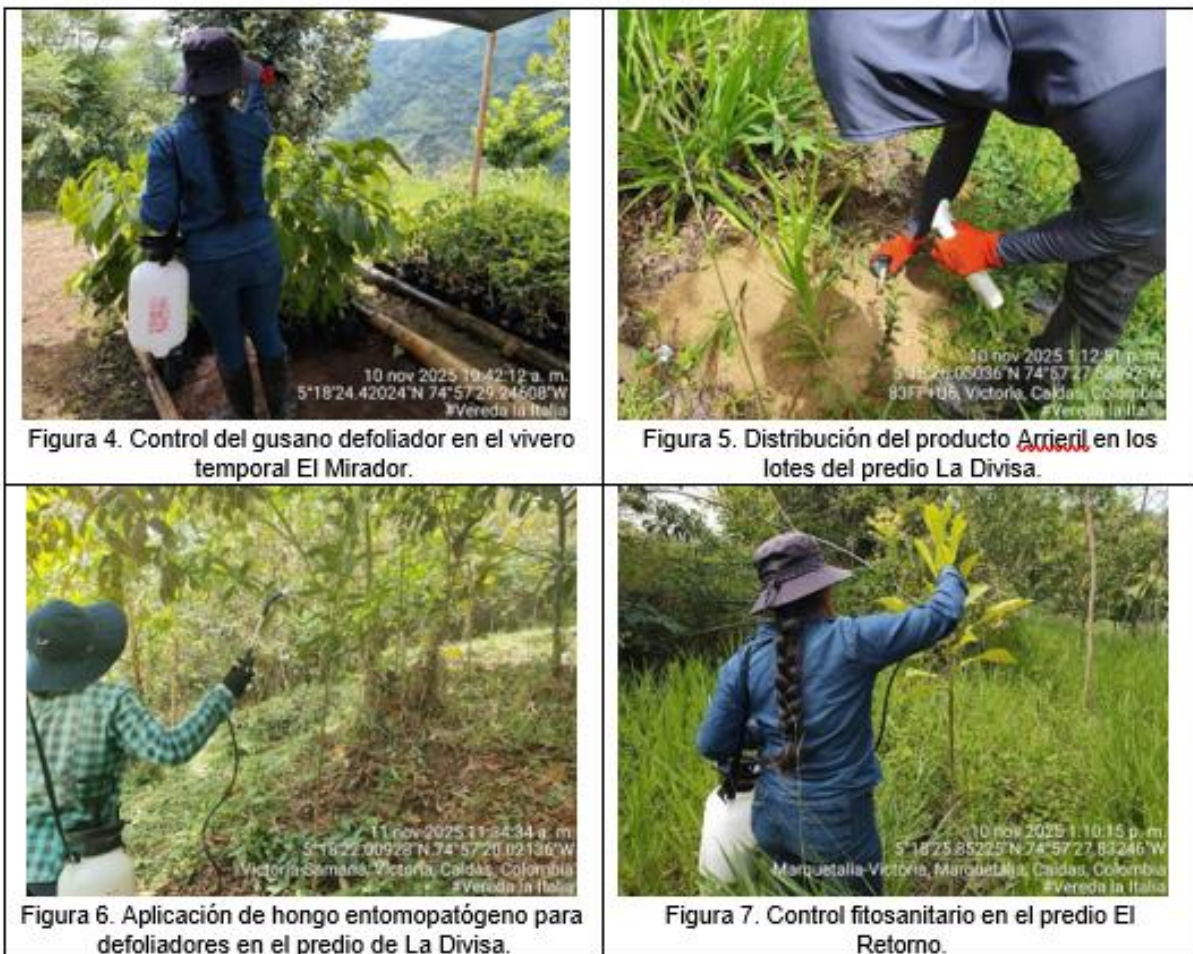
Tabla 8. Registro fotográfico control fitosanitario en la Compensación Forestal Guarino.