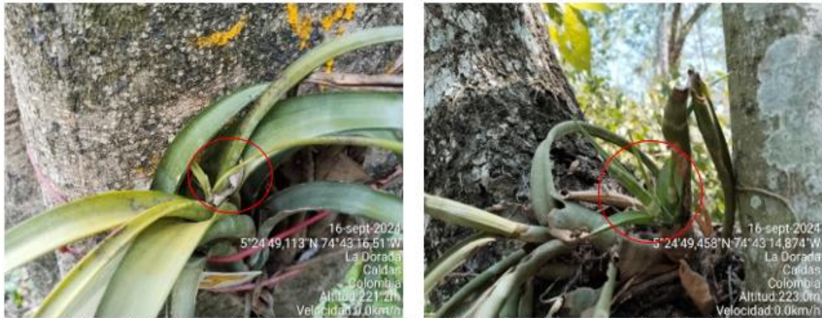
Fotografía 2. Presencia de nuevas raíces en la epifita N°14 de la especie Tillandsia flexuosa