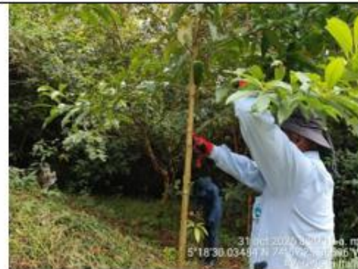
Figura 10. Podas de formación del fuste del árbol de la especie Espadero – Myrsine pellucidopunctata .